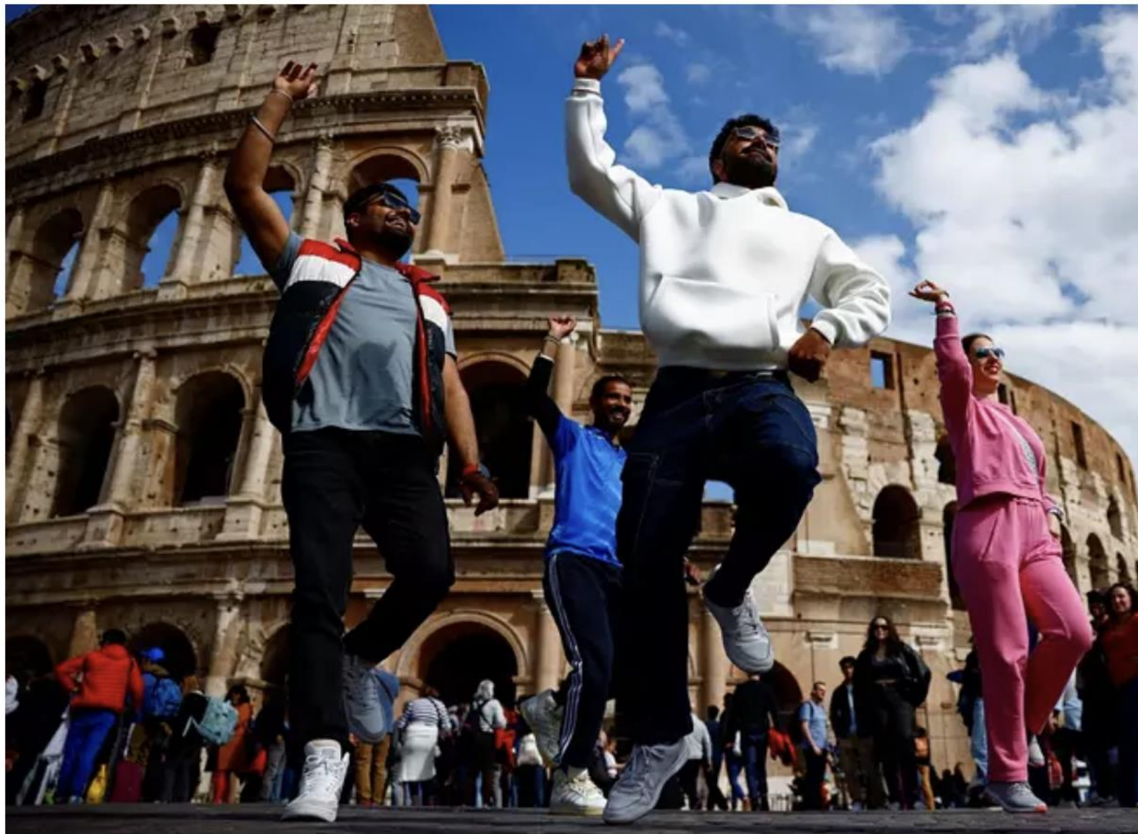
Joukko turisteja tanssahteli Roomassa Colosseumin edustalla huhtikuussa.

Nyt jo yli puolet maapallon ihmisistä elää alueilla, joilla on jonkinlainen vesipula.