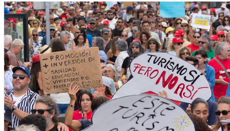
Huhtikuussa 2024 massaturismia vastaan osoitettiin mieltä Lanzarotella.

Massaturismin vaikutukset kuumentavat tunteita – "Matkailijat eivät pysykään enää niissä tiloissa, jotka on varattu heille"