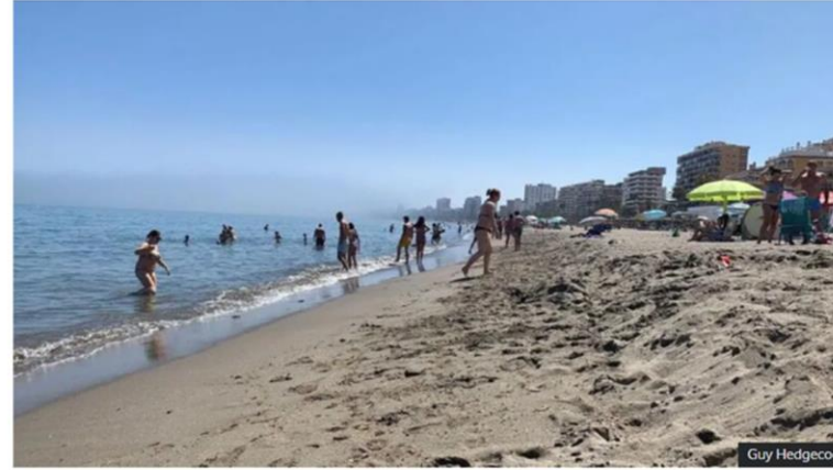
Spain's coastline has been attracting northern Europeans for more than 50 years

Massaturismin vaikutukset kuumentavat tunteita – "Matkailijat eivät pysykään enää niissä tiloissa, jotka on varattu heille"